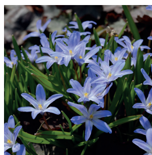
Scilla siberica Sibirischer Blaustern Scille de Sibérie