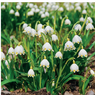
Leucojum vernum Märzenbecher Nivéole de printemps