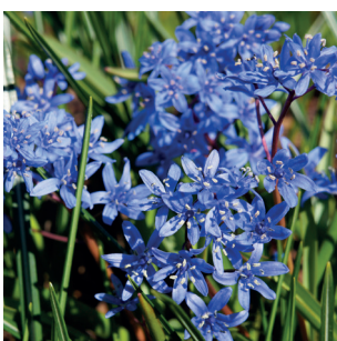
Scilla bifolia Zweiblättriger Blaustern Scille à deux feuilles