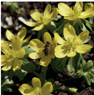
Eranthis hyemalis Winterling Hellébord d'hiver