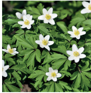
Anemone nemorosa Buschwindröschen Anémone des bois