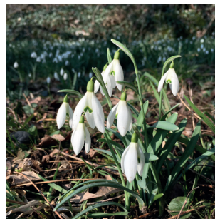
Galanthus nivalis Schneeglöckchen Perce-neige