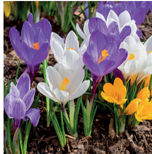
Crocus Krokus Crocus