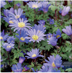
Anemone blanda Balkan-Windröschen Anémone de Grèce

Blumenzwiebeln sind das Tüpfelchen auf dem „i“. Wenn sie im Herbst gepflanzt wurden, bereiten sie den frischgeschlüpften Bestäubern die erste Nahrung und Ihrem Garten/Balkon und einen bunten Start in den Frühling. Unsere Partnergeschäfte bieten Ihnen mindestens 3 der folgenden Blumenzwiebeln in Bio-Qualität an.