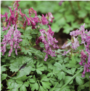
Corydalis Lerchensporne Corydalis