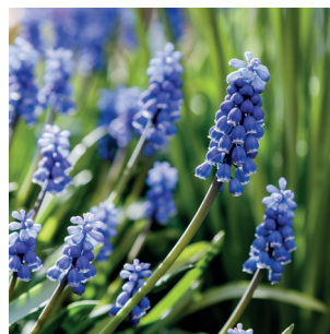
Muscari armeniacum Traubenhyazinthe Muscari d'Arménie